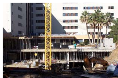
El aparcamiento en obra.

En las zonas ajardinadas se plantaron Palmeras de la familia de "Howea forsteryana" cuya altura puede llegar hasta 15 m. El resto de la superficie esta cubierto de césped. Se ha previsto un riego automático de la zona ajardinada.