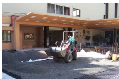
Relleno por medio de cargadores de ruedas.