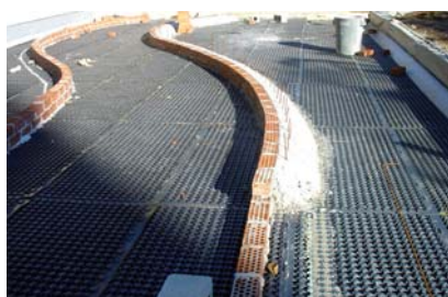
Demarcación de calzada para el espacio verde.