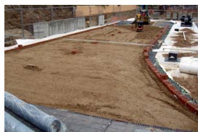
Realización de la capa base.

ZinCo Cubiertas Ecológicas S.L. • Calle París 45-47, entlo. 3ª • E-08029 Barcelona • Teléfono +34 / 93 / 3556208 Fax +34 / 93 / 4102303 • www.zinco-cubiertas-ecologicas.es • Correo electrónico: contacto@zinco-iberica.es