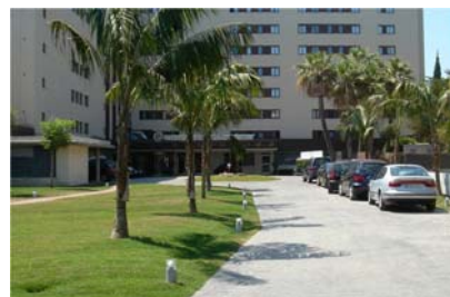
La misma vista terminada la obra.

Pavimento impreso 15 cm Zahorra no calcárea Filtro PV Stabilodrain SD 30 Filtro PV Impermeabilización antirraiz