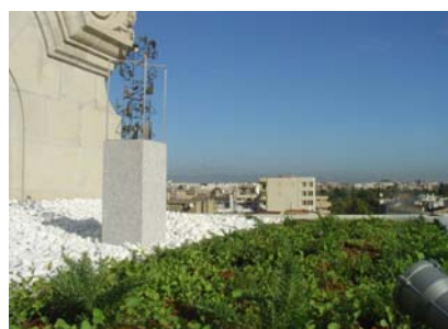
Símbolo de la construcción moderna en conjunto con arquitectura medieval.