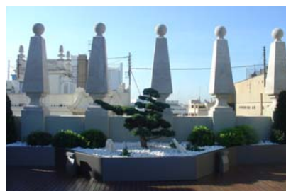
Las columnas ofrecen la sensación de un ambiente medieval a la terraza.