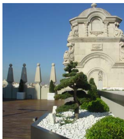
Vista parcial de la zona transitable.