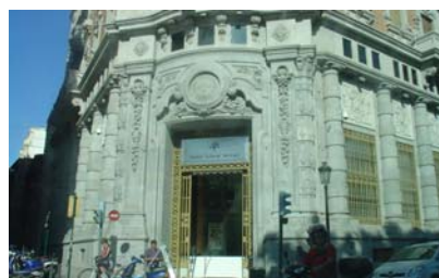
Entrada principal al edificio.