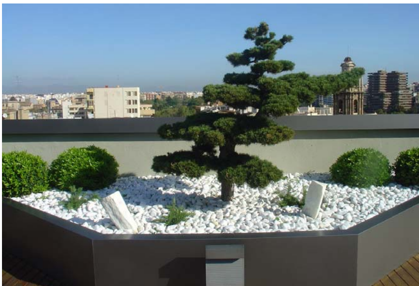
Una de las jardineras de la terraza.