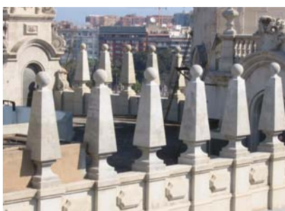
Vista desde una terraza vecina.