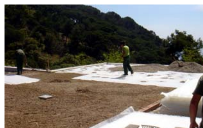
Colocación del Filtro tipo PV y ubicación de la grava.