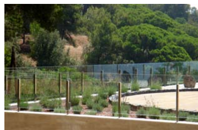
Terraza con barandilla adecuada para ceder la vista libre al Mediterráneo.

Los servicios de agua y el tendido eléctrico pasan por encima de las placas drenantes, totalmente ocultos a la visibilidad del público. Las cajas de registro tipo KS 30 de acero inoxidable permiten el acceso fácil a los seis sumideros para control y trabajos de servicio.