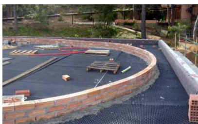
Las placas Floradrain® FD 40 colocadas y utilizadas de encofrado perdido.