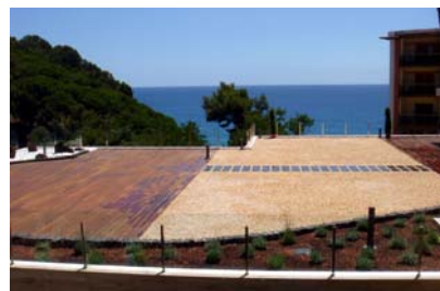
La cubierta se separa en zona ajardinada, pavimentos de madera lpe y de grava.