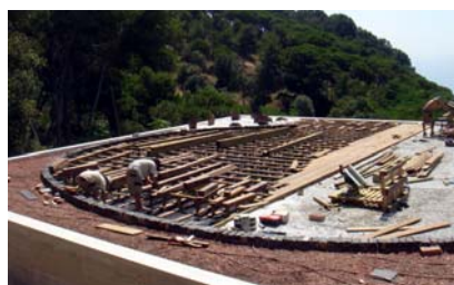
Montaje del pavimento de madera lpe.