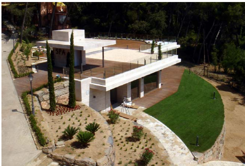
El nuevo área SPA del Hotel Santa Marta***** de Lloret de Mar.