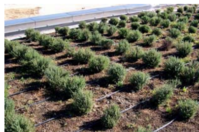
Vegetación variada sobre los diversos edificios.