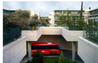
Pasos subterráneos ajardinados.