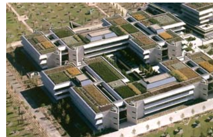
Esta vista aérea muestra el carácter individual de cada espacio vegetal.

La ciudad financiera "Banco de Santander" se encuentra próxima a Madrid y es uno de los proyectos de cubiertas ajardinadas más grandes del mundo. Más de 100.000 m 2 de la superficie de cubiertas han sido ajardinadas con sistemas de tipo extensivo e intensivo. Además de impresionar por sus dimensiones, este proyecto llama la atención por el diseño paisajístico. La planificación de este paisaje fue todo un desafío por las condiciones climáticas y arquitectónicas en las que está enmarcado. Los diferentes tipos de sistemas fueron escogidos en conformidad con las comunidades vegetales que los rodea.