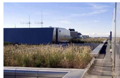
Combinación de caminos y zonas verdes entre edificios diferentes.