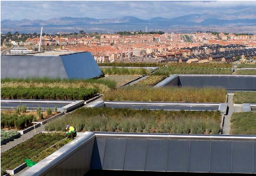
La ciudad financiera "Banco de Santander", Madrid.