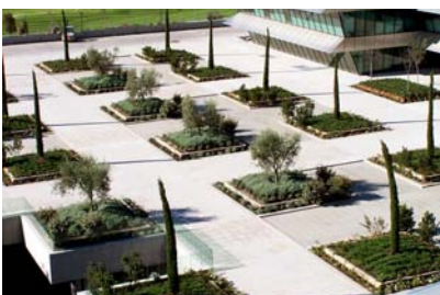
Árboles sobre el garaje subterráneo.