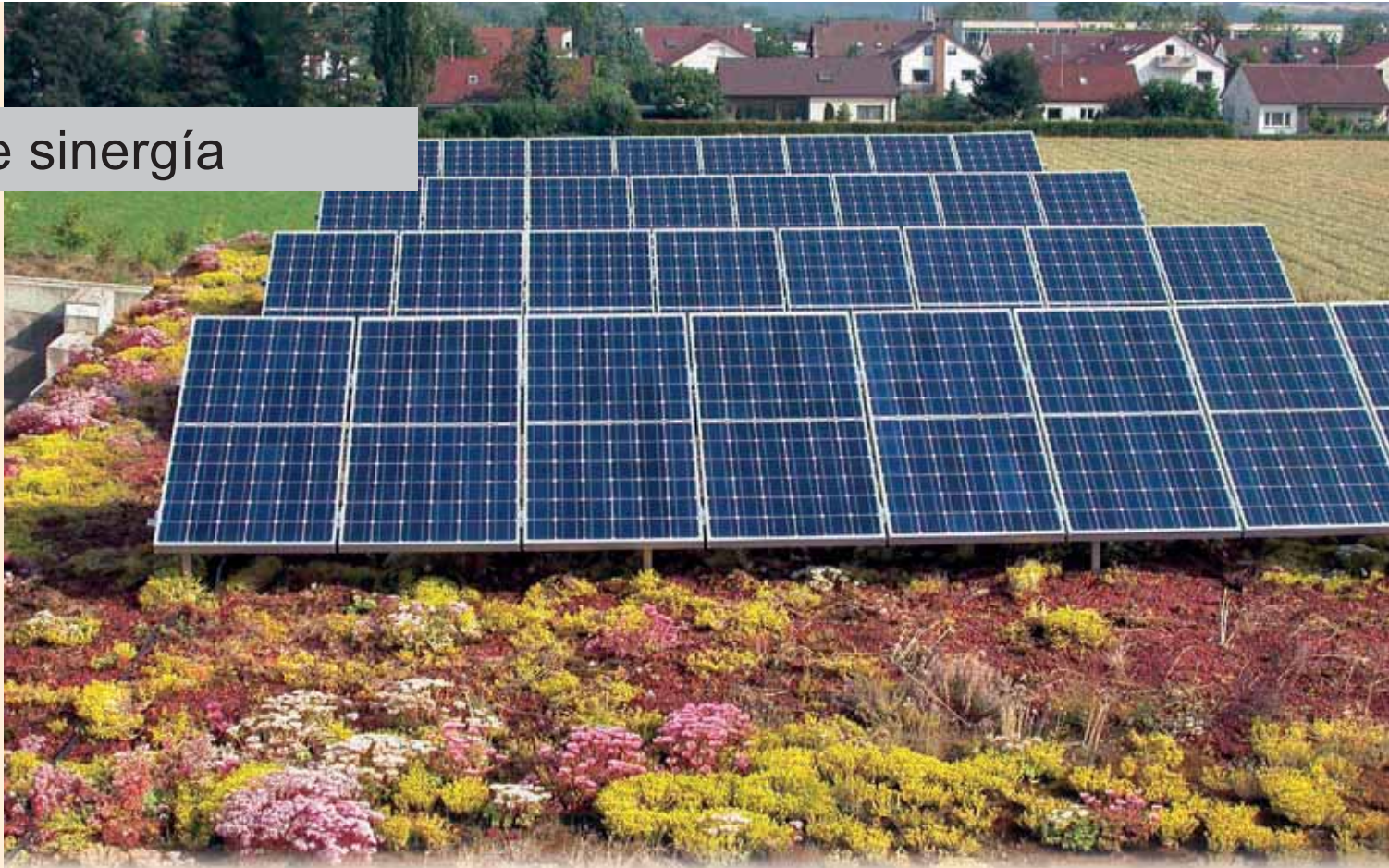
Cubierta de la empresa ProNatur en el municipio de Metzgingen, Alemania.