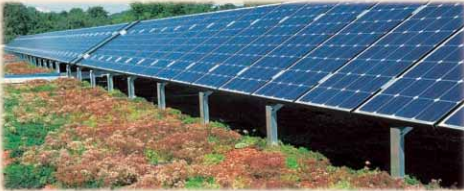
Instalación fotovoltaica en la cubierta del Colegio de Educación Primaria y Secundaria obligatoria de Unterensingen, Alemania.

animales, además retienen el agua pluvial, mejoran el microclima y, siendo superficies ajardinadas son jardines y espacios de descanso. Con el desarrollo de la base solar ZinCo ofrece otra ventaja más de las cubiertas ajardinadas. A partir de ahora se puede aprovechar también la energía solar integrándola en la construcción de una cubierta ecológica. Con la base solar se pueden combinar tanto módulos para la generación de electricidad (módulos fotovoltaicos) como también sistemas para el calentamiento de agua (termia solar) con la construcción de ajardinamiento.